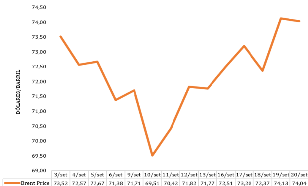
Gráfico 1 – Preços do Brent

O gráfico infra ilustra os preços diários do Brent, de 03 a 20 de setembro de 2024 2 . O preço médio do mês de setembro (72,26 USD), relativamente ao do mês anterior (78,40 USD), registou uma diminuição de 7,83%.