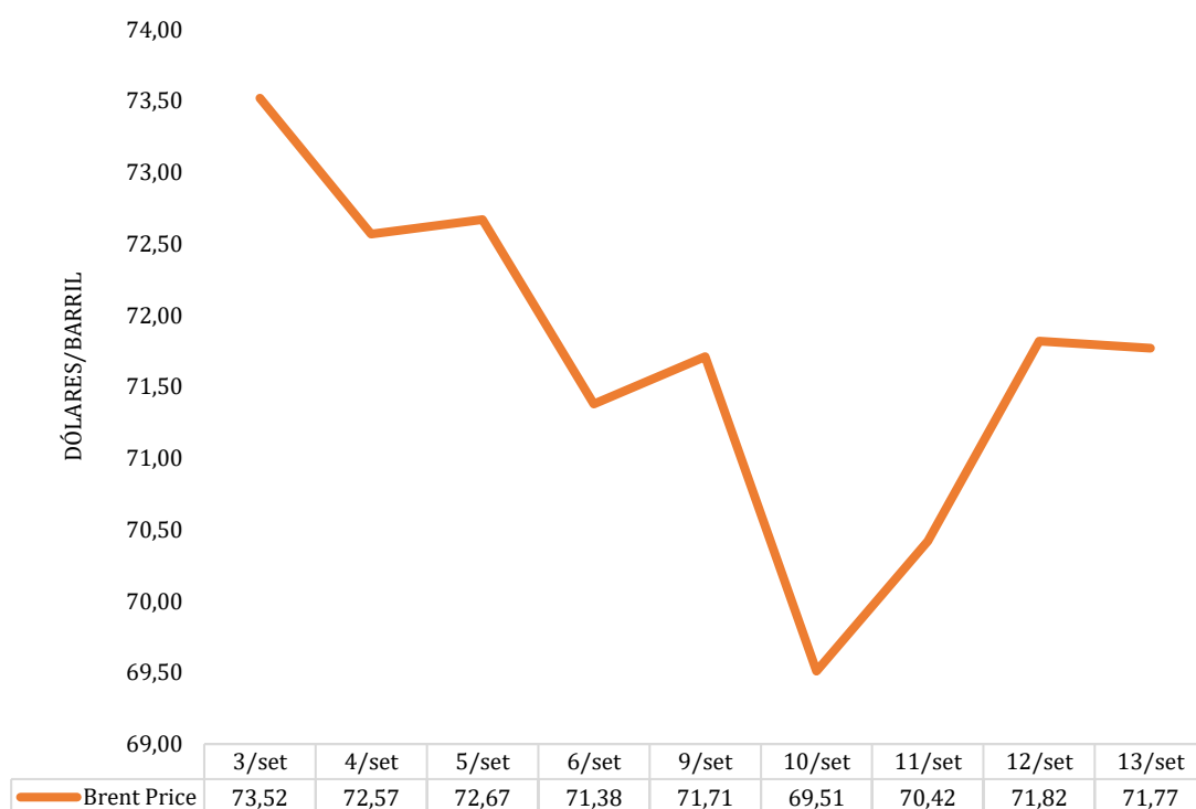
Gráfico 1 – Preços do Brent

O gráfico infra ilustra os preços diários do Brent, de 03 a 13 de setembro de 2024 2 . O preço médio do mês de setembro (71,71 USD), relativamente ao do mês anterior (78,40 USD), registou uma diminuição de 8,53%.