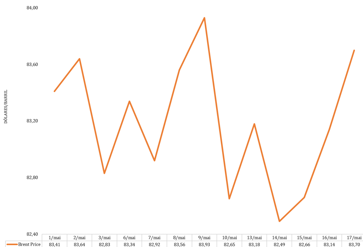
Gráfico 1 – Preços do Brent

O gráfico infra ilustra os preços diários do Brent, de 01 a 17 de maio de 2024. O preço médio do mês de maio (83,19 USD), relativamente ao do mês anterior (88,41 USD), registou uma diminuição de 5,91%.