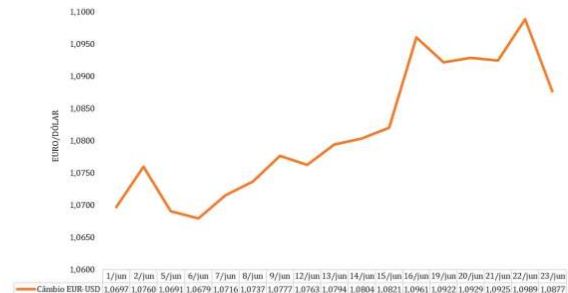
Gráfico 3 – Câmbio Euro/Dólar

Os preços do petróleo e dos seus derivados são cotados em dólar. Em relação à semana anterior, a cotação média do euro registou uma apreciação de 0,92% face ao dólar, tendo como referência a BLOOMBERG (14 horas no horário de Frankfurt), aumentando de 1,0828 para 1,0928 EUR/USD. O gráfico seguinte evidencia a evolução diária do câmbio Euro/Dólar, de 01 a 23 de junho de 2023.