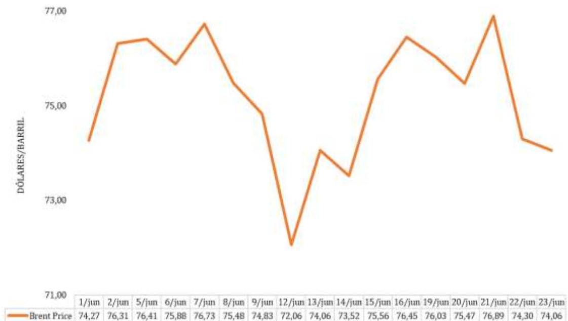
Gráfico 1 - Preços do Brent

O gráfico infra ilustra os preços diários do Brent, de 01 a 23 de junho de 2023. O preço médio neste período (75,19 USD), relativamente ao do mês de maio (75,59 USD), registou uma diminuição de 0,52%.