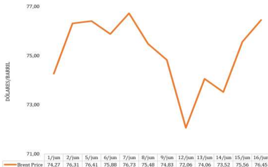
Gráfico 1 - Preços do Brent

O gráfico infra ilustra os preços diários do Brent, de 01 a 16 de junho de 2023. O preço médio neste período (75,13 USD), relativamente ao do mês de maio (75,59 USD), registou uma diminuição de 0,60%.