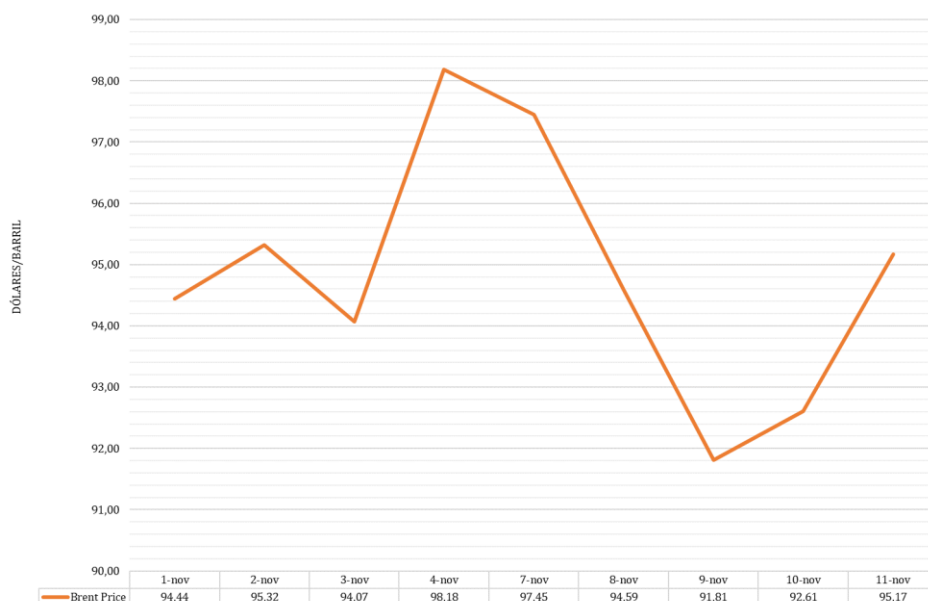
Gráfico 1 – Variação do preço do Brent, de 1 a 11 de novembro

O gráfico infra ilustra a variação do preço do Brent de 1 a 11 de novembro. A variação média do preço neste período, relativamente ao mês de outubro, registou um aumento de 2,61%.